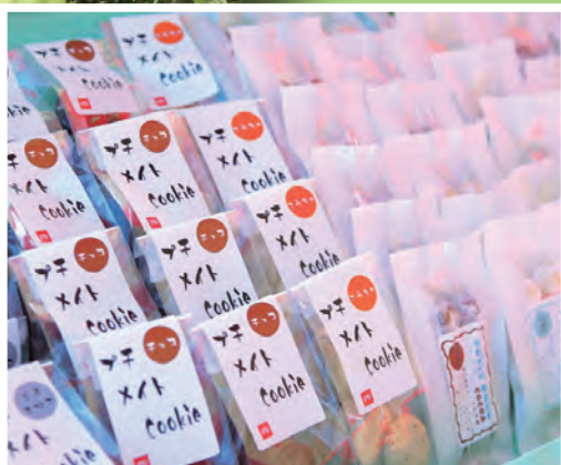
パン・お菓子販売など 楽しいテントがあります