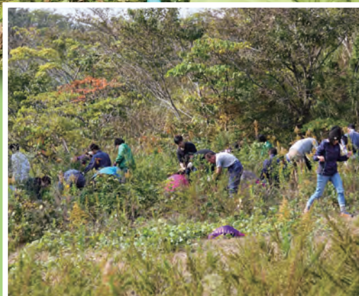
育樹 (草むしり) の様子