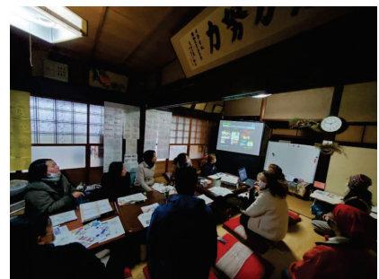
里山の古民家で開催されるセミナー