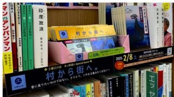
KaBoS 宮前平店では、土曜日の会の特設棚を設け、ゲストの著作を販売しております。この機会にぜひお買い求めください。