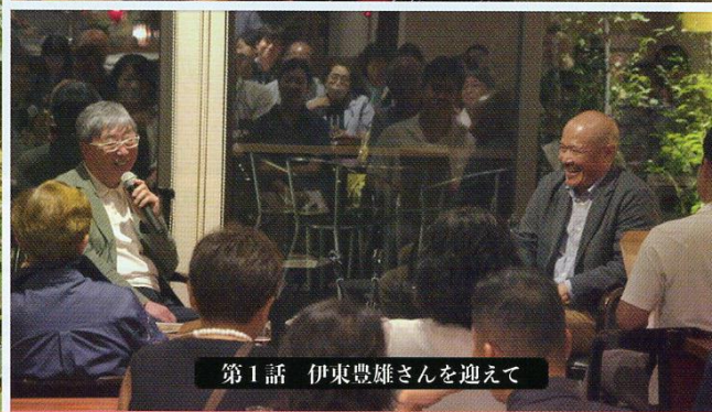
第1話 伊東豊雄さんを迎えて