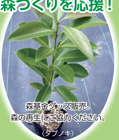
森基金グッズ販売。 森の再生にご協力ください。 (タブノキ)